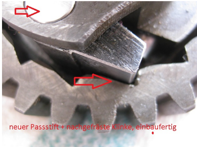
neuer Passstift + nachgefräste Klinke, einbaufertig